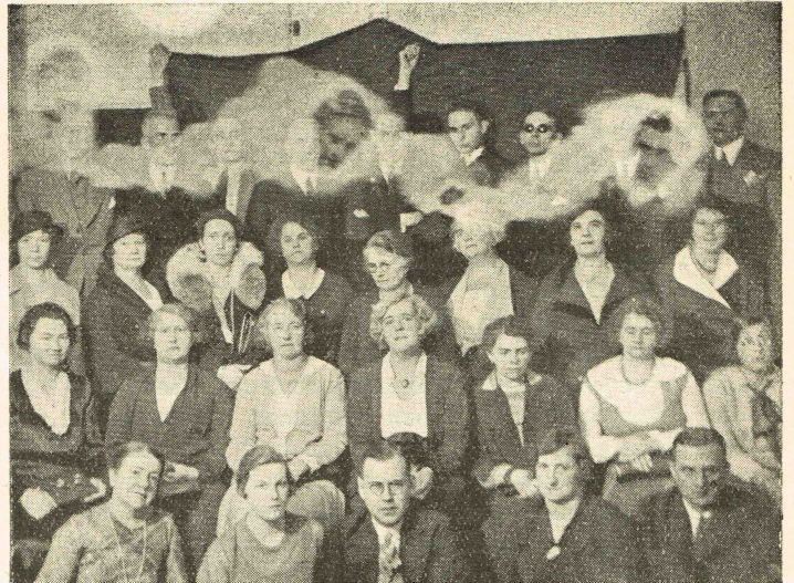
Foto, opgenomen op 25 Sept. 1932 in het College voor Psychische Wetenschappen, te 's-Gravenhage. Drie der intelligenten zijn door de aanwezigen herkend.

Er is reeds veel geschreven over geestesfotografie: veel ervóór en veel ertegen, doch voor ons Spiritisten en voor hen, die de Spiritistische verschijnselen kennen en aanvaardden, ligt een schoon,