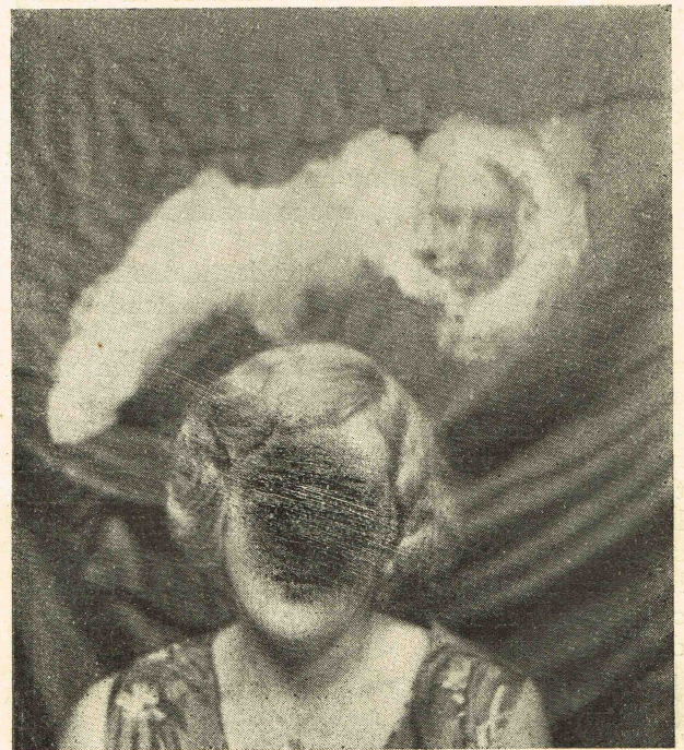
Foto opgenomen in het College voor Pychische Wetenschappen, 's-Gravenhage. Deze intelligent werd oorspronkelijk niet herkend. Het bleek echter later de contróle van een der dochters dezer dame te zijn. Om persoonlijke redenen is het gelaat onkenbaar gemaakt.